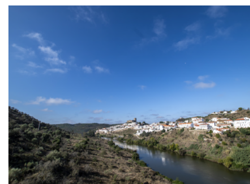
Río/ Rio Guadiana (Mértola, Portugal)

https://geoguadiana.chguadiana.es/descargaszip/vinculos/FormularioPropuestasEpTI-PHD4-GUADIANA_V00.docx