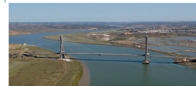
Puente Internacional sobre el río Guadiana, entre Huelva y El Algarve / Ponte Internacional sobre o rio Guadiana, entre Huelva e o Algarve

https://geoguadiana.chguadiana.es/descargaszip/vinculos/FormularioPropuestasEpTI-PHD4-GUADIANA_V00.docx