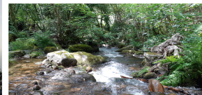
Río Trancoso– Ponte Barxas